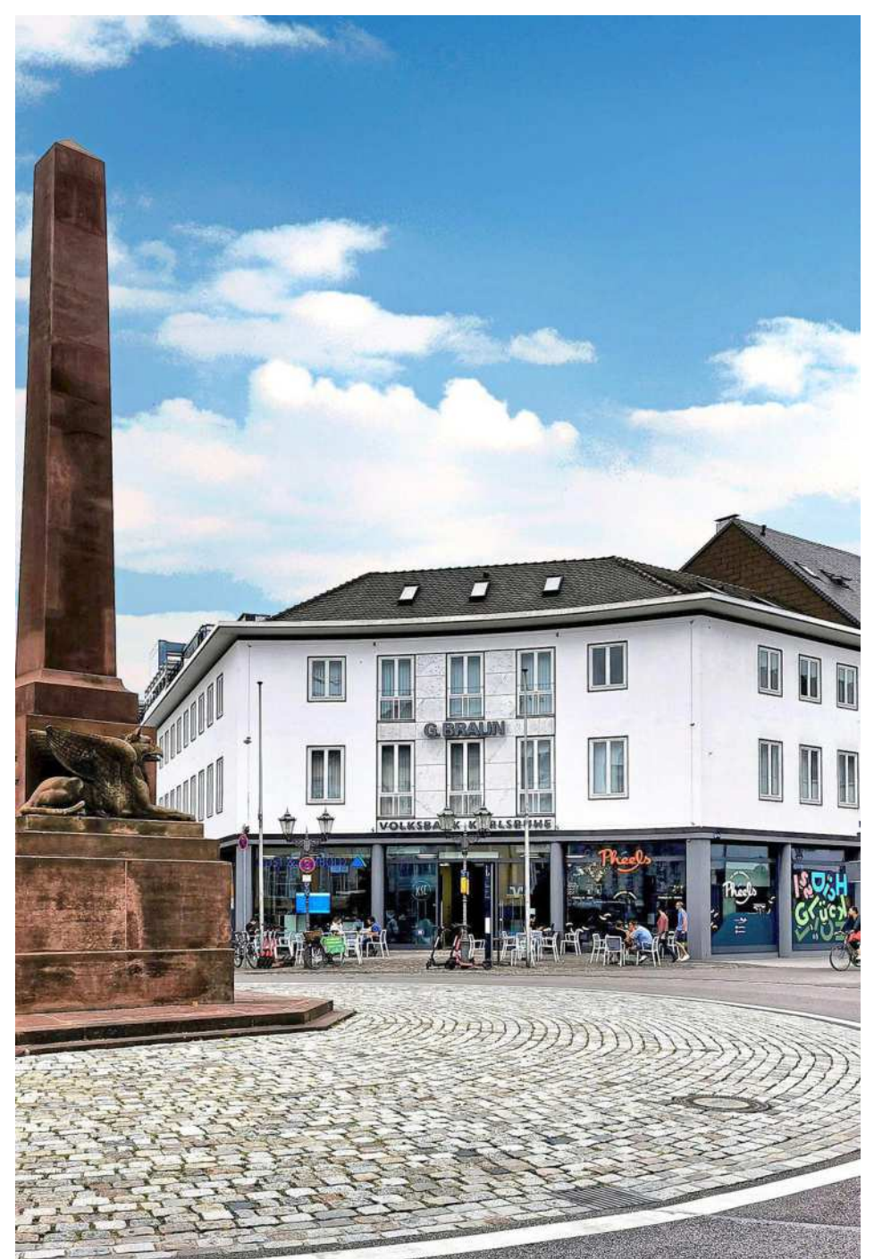
In idealer Lage am Rondellplatz bietet die neue Regionalfiliale eine ideale Mischung aus Service und Erlebnis. Im Eingangsbereich befinden sich der KSC-Fanshop und „Pheels“.