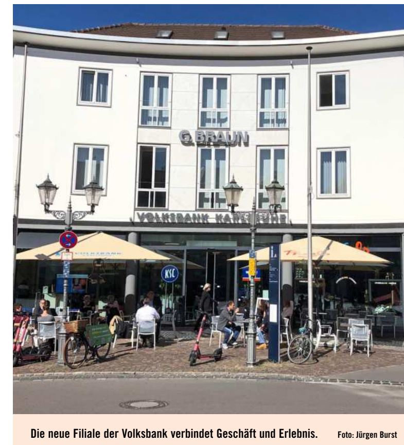
Die neue Filiale der Volksbank verbindet Geschäft und Erlebnis.