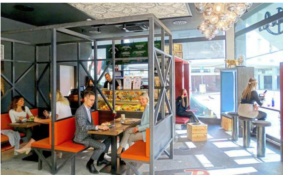
Unter dem Motto „Iss dich glücklich“ bietet die neue Gastronomie „Pheels“ im Eingangsbereich der Regionalfiliale ein außergewöhnliches Geschmackserlebnis in Wohlfühlambiente.

„PHEELS“: Das Schnellrestaurant für Feinschmecker und Genießer