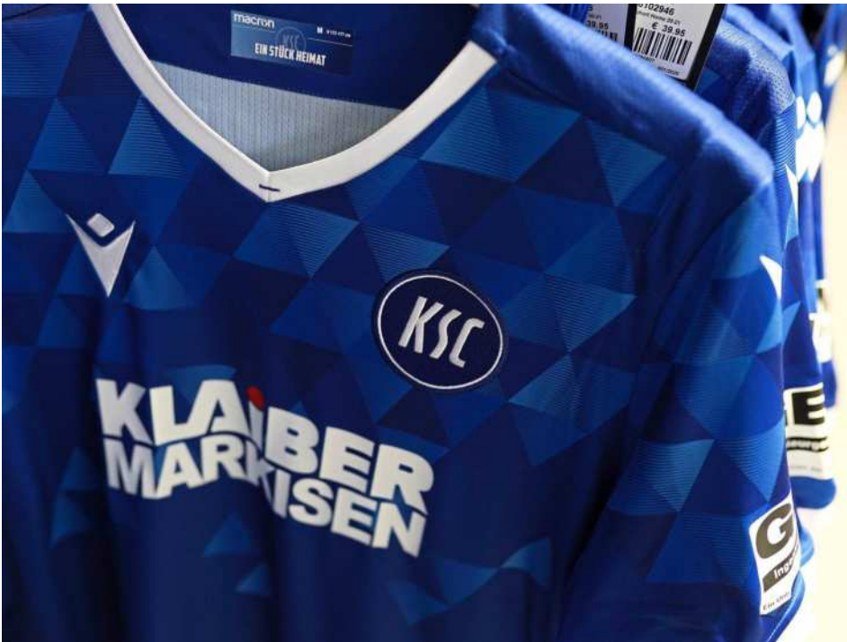
Zum besonderen Top-Seller der Saison 2020/2021 dürfte das neue Pyramiden-Trikot avancieren, das selbstverständlich im Fanshop am Rondellplatz erhältlich ist.

mit Hust & Herbold Immobilien, dem Fachzentrum Finanzieren.Bauen.Wohnen., dem Fanshop des Karlsruher Sport Club und dem Gastronomiekonzept „Pheels“