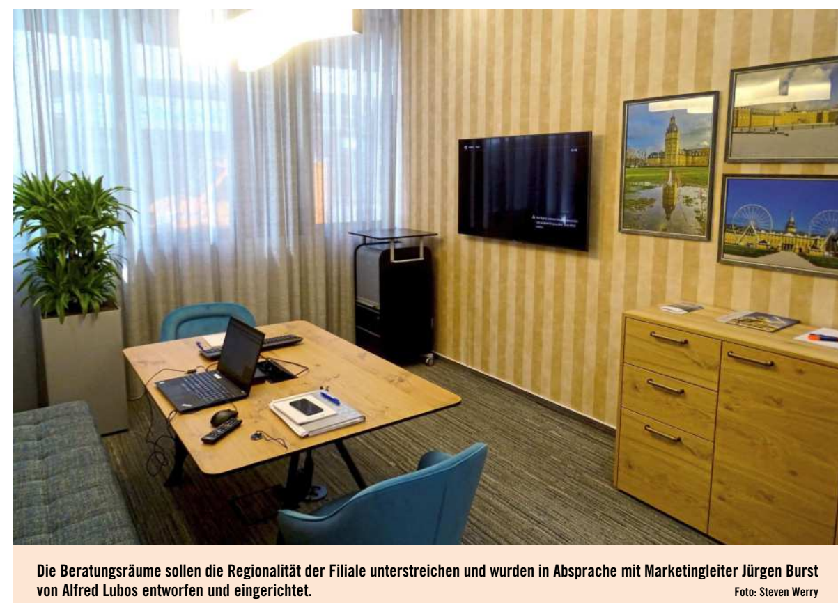
Die Beratungsräume sollen die Regionalität der Filiale unterstreichen und wurden in Absprache mit Marketingleiter Jürgen Burs von Alfred Lubos entworfen und eingerichtet.