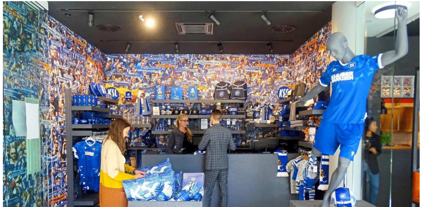
Ganz egal ob es um Fanartikel oder Tickets geht, der neue KSC-Fanshop steht allen Fans und solchen, die es noch werden wollen, offen. Und falls ein Fan-Produkt im Shop mal nicht vorhanden ist, kann man es hier problemlos bestellen und am nächsten Tag abholen.