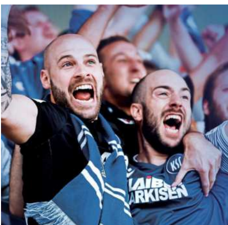
So richtig schön jubeln lässt es sich nur in den passenden Fan-Utililien.