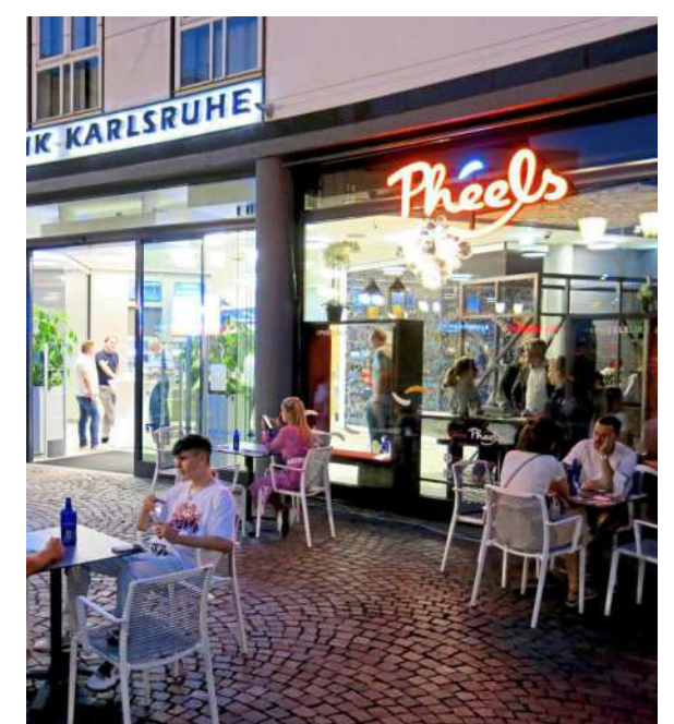
In den Sommermonaten können die Gäste die Speisen und Getränke im Außenbereich genießen.