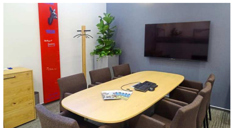
Wer die persönliche Beratung zu Fragen rund um den „Wohnfächer“ möchte, ist in den Räumlichkeiten der neuen Regionalfiliale, wie hier im Beratungsraum „Wirtschaft“, genau richtig.

Auf die Zuverlässigkeit der Partnerunternehmen können sich Wohnfächer-Benutzer verlassen. Damit fördert und stärkt die Volksbank Karlsruhe die Zusammenarbeit mit Unternehmen in der Region und bringt Auftraggeber und Auftragnehmer intuitiv auf einer modernen Plattform zusammen. Auch Fir-