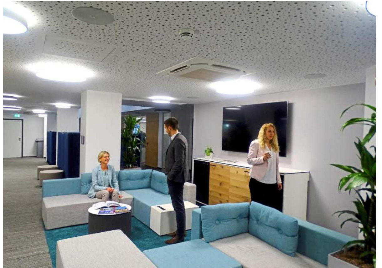
In der neuen Filiale hat man nicht das Gefühl, man sei in einer klassischen Bank. Der Kunde soll sich hier wohlfühlen können und den Besuch als besonderes Ereignis erleben.