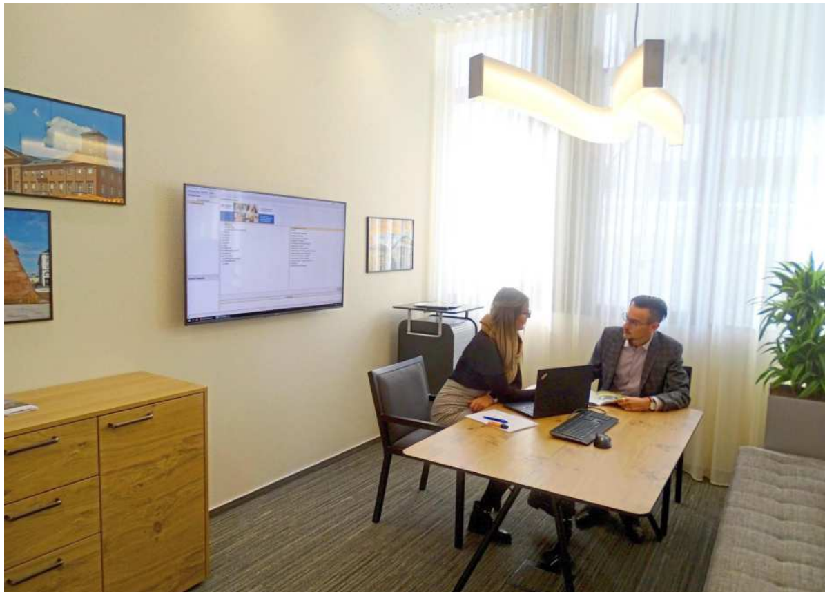
Die Regionalität spiegelt sich im Design der Beratungsräume wieder. Bei einem Termin können die Kunden einen der verschiedenen, nach entsprechenden Themen gestalteten Räume auswählen. So wie hier zum Beispiel der Raum „Marktplatz“.

mit Hust & Herbold Immobilien, dem Fachzentrum Finanzieren.Bauen.Wohnen., dem Fanshop des Karlsruher Sport Club und dem Gastronomiekonzept „Pheels“