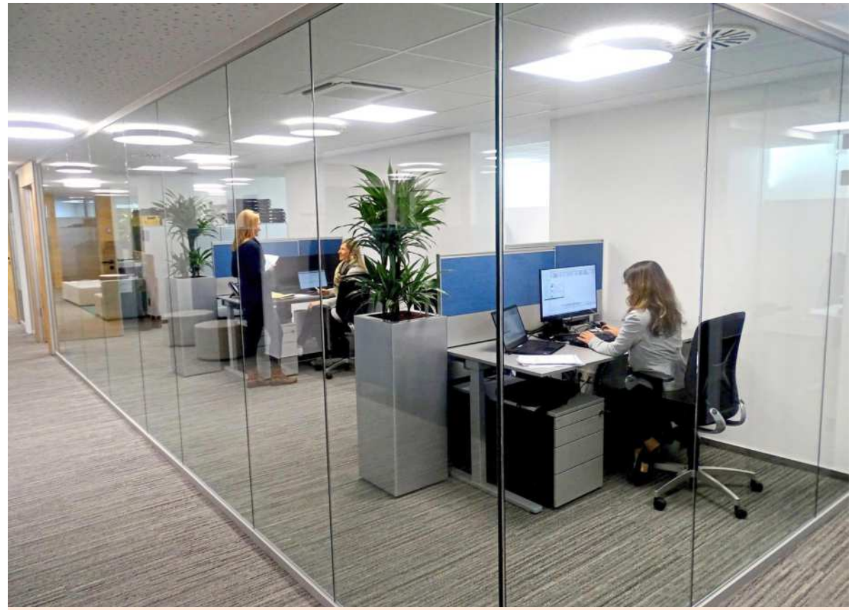
Die helle und freundliche Atmosphäre sorgt gezielt dafür, dass sich nicht nur die Kunden sondern auch die Mitarbeiter in den modernen Büros der Filiale wohlfühlen.